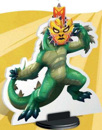
Exemple de Masque attaché à un Monstre