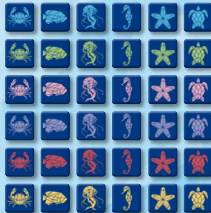
36 tuiles Créature marine