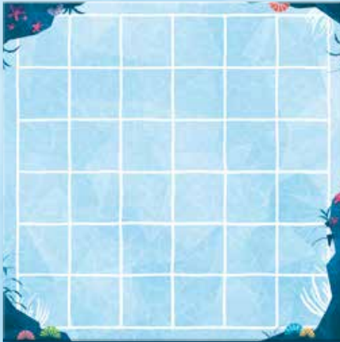
1 plateau Récif